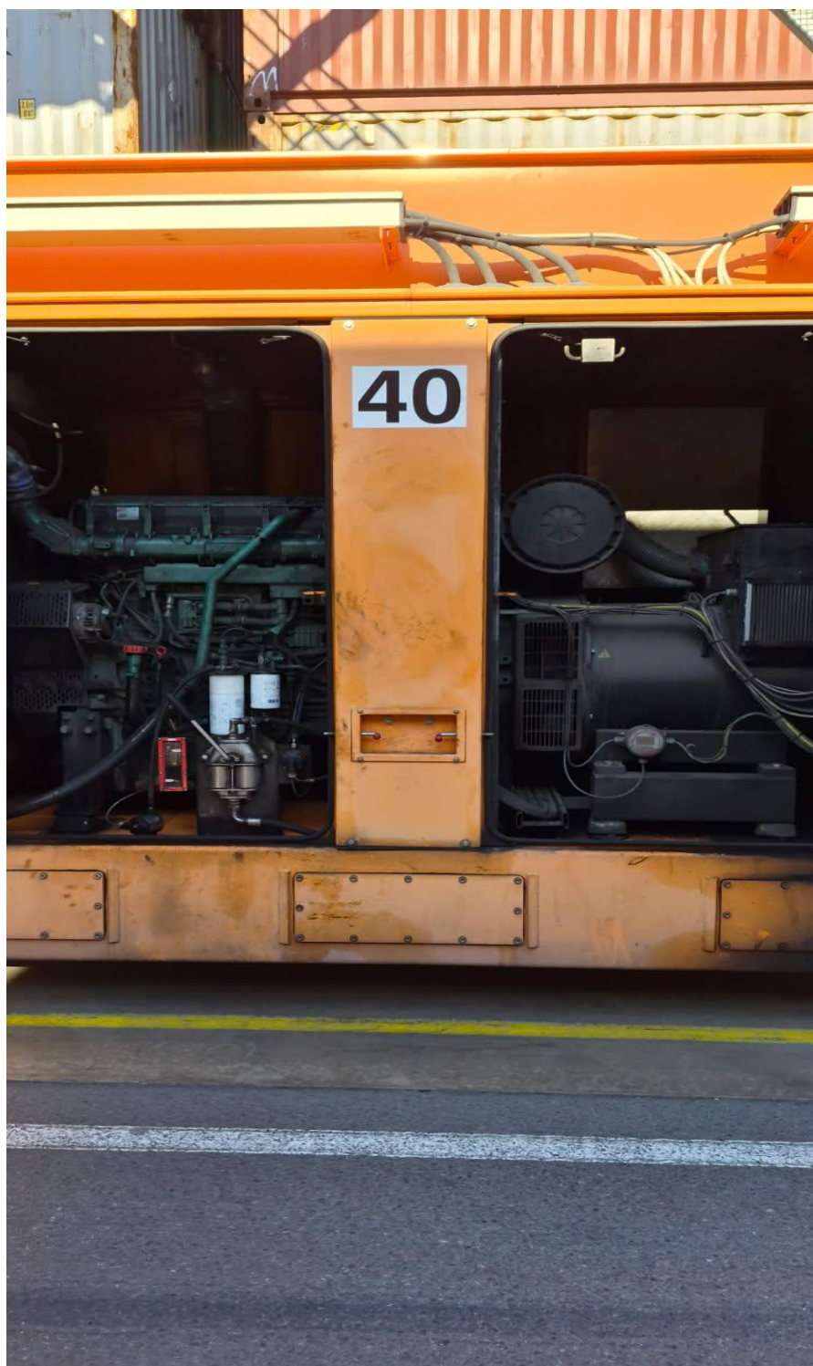
Slika 3: Strojnica RTG 40 (pogonski agregat in generator)